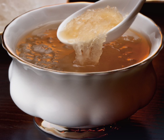
皇家燕窩 ROYAL BIRD'S NEST